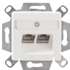
Abb.1: UP/K Anschlussdose CSA Plus 2/8 Cat.6 A mit Zentralkappe

mit einer oder zwei RJ45-Buchsen Cat.6 A (IEC) geschirmt