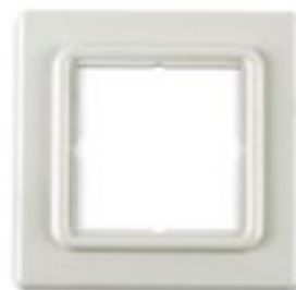
Abb.4: Abdeckrahmen 80 x 80 mm