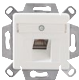
Abb.2: UP/K Anschlussdose CSA Plus 1/8 Cat.6 A mit Zentralkappe